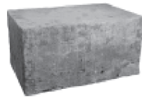
36 po (L) x 18 po (l) x 24 po (H) 915mm x 457mm x 610mm