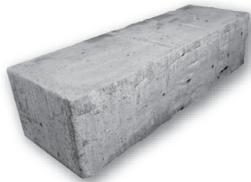
72 po (L) x 18 po (l) x 24 po (H) 1829mm x 457mm x 610mm