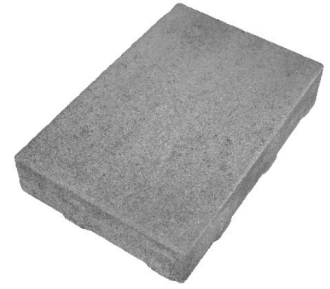
长 13.58 英寸 × 宽 9.05英寸 × 深 2.36 英寸 345毫米 × 230毫米 × 60毫米