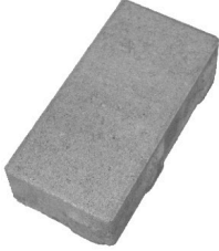
长 9.05 英寸 × 宽 4.52 英寸 × 深 2.36 英寸 230毫米 × 115毫米 × 60毫米