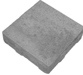
长 9.05 英寸 × 宽 9.05英寸 × 深 2.36 英寸 230毫米 × 230毫米 × 60毫米