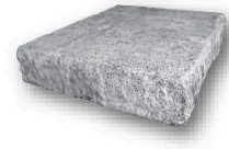
STEP 3 PI

48 po (L) x 7 po (H) x 18 po (P) 1220mm x 178mm x 457mm