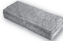
长 16.10 英寸 × 宽 6.42 英寸 × 深 2.76 英寸 409毫米 × 163毫米 × 70毫米