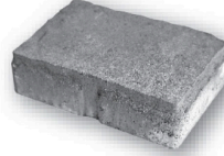
长 9.65 英寸 × 宽 6.42 英寸 × 深 2.76 英寸 245毫米 × 163毫米 × 70毫米