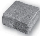
长 6.42 英寸 × 宽 6.42 英寸 × 深 2.76 英寸 163毫米 × 163毫米 × 70毫米