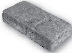
长 12.87 英寸 × 宽 6.42 英寸 × 深 2.76 英寸 327毫米 × 163毫米 × 70毫米